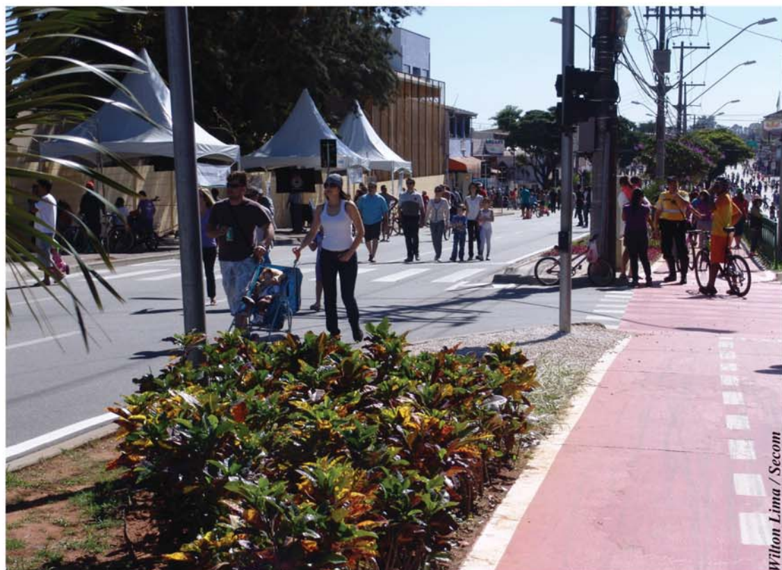
Wilton Lima / Secom

Depois da apresentação do Taiko - o tambor japonês, o Via Viva continua a relembrar a cultura japonesa com uma aula de karatê das 9h às 12h, na Avenida Itavuvu. O programa municipal realizado todo domingo das 8h às 13h, terá também em sua 11ª edição, a participação do Instituto Anhanguera Educacional, que oferecerá serviços de saúde: aferição de pressão arterial, orientações posturais e ergonômicas, aquecimento, alongamento pré e pós-atividade física, orientações à saúde e bem estar dos participantes.