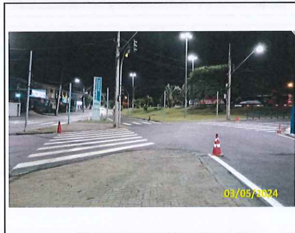
Foto 04 Pintura de travessias