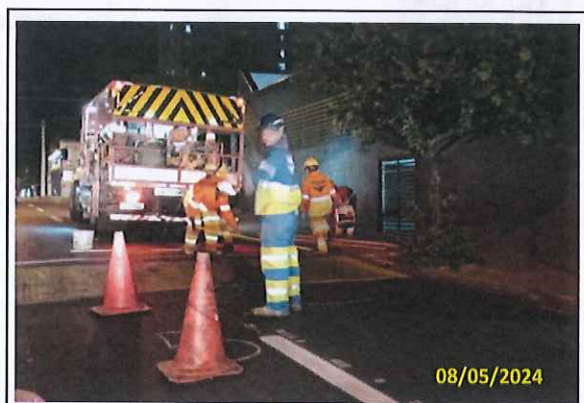
Foto 06 Pintura da lombada