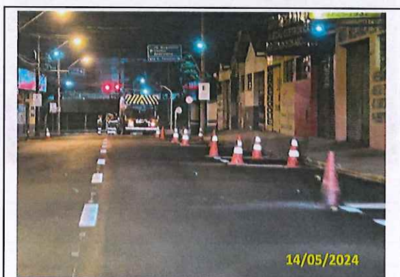
Foto 08 Sinalização