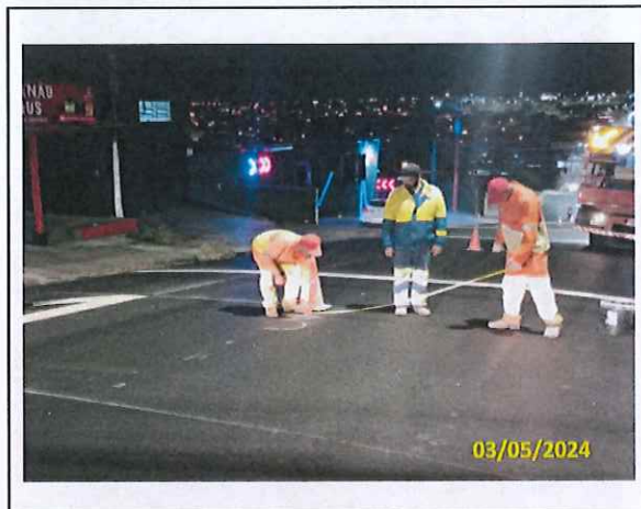
Foto 02 Pintura horizontal em andamento