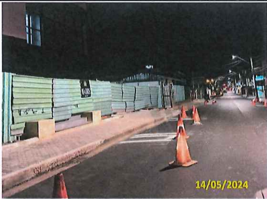
Foto 09 Sinalização horizontal executada