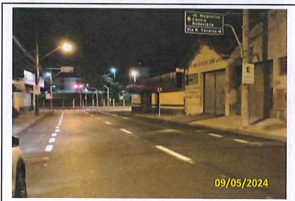
Foto 07 Pintura das faixas seccionadas