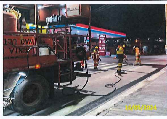
Foto 12 Sinalização horizontal em andamento