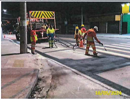
Foto 11 Sinalização horizontal em andamento