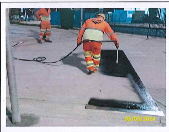
Foto 03 Aplicação do promotor de aderência