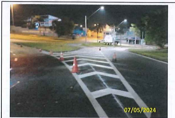
Foto 05 Pintura da área zebra