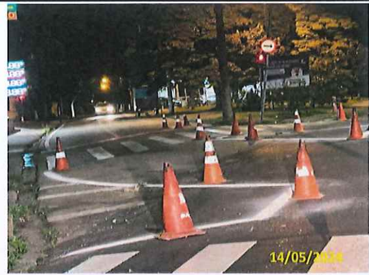
Foto 10 Sinalização horizontal executada