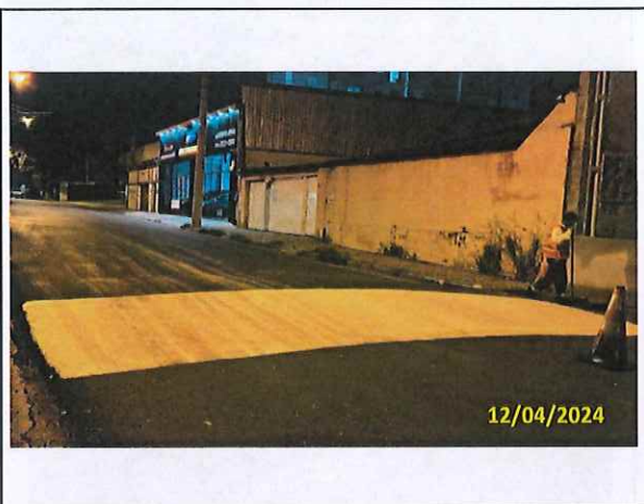
Foto 01 Pintura de lombada

- Sinalização horizontal e vertical - Trecho 5