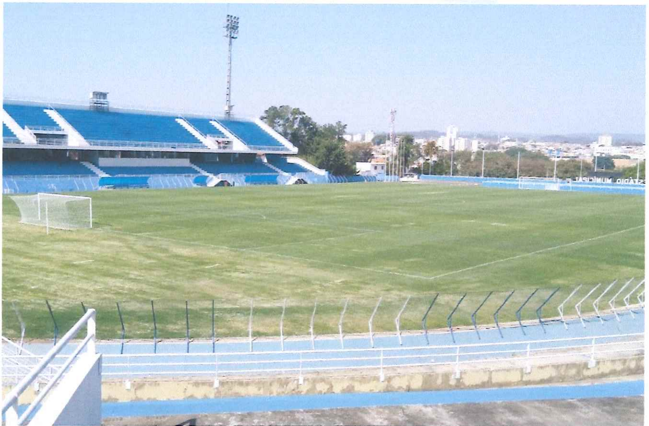
Figura 5 - Evolução do gramado.