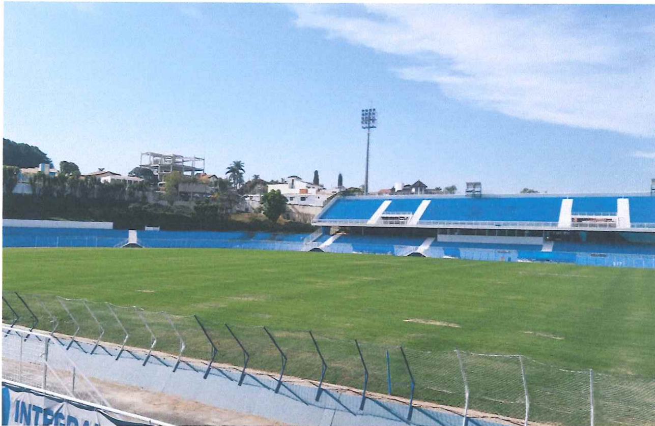
Figura 2 - Evolução do gramado.