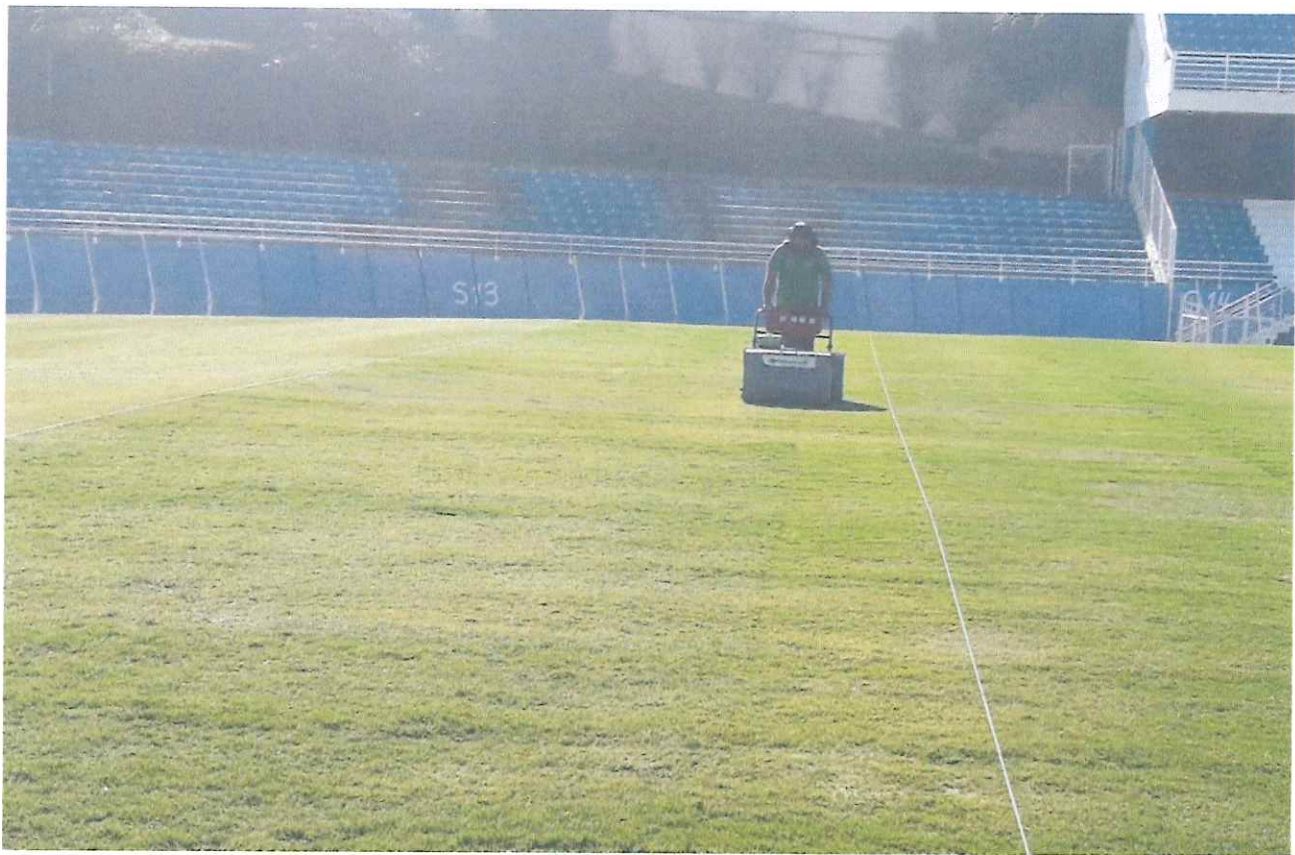
Figura 6 - Corte mecanizado.