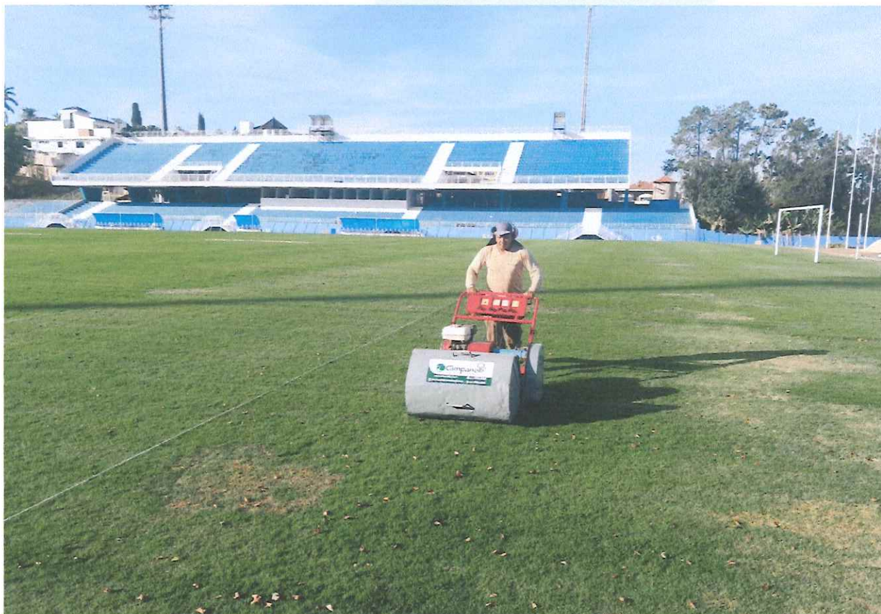
Figura 1 - Corte mecanizado.