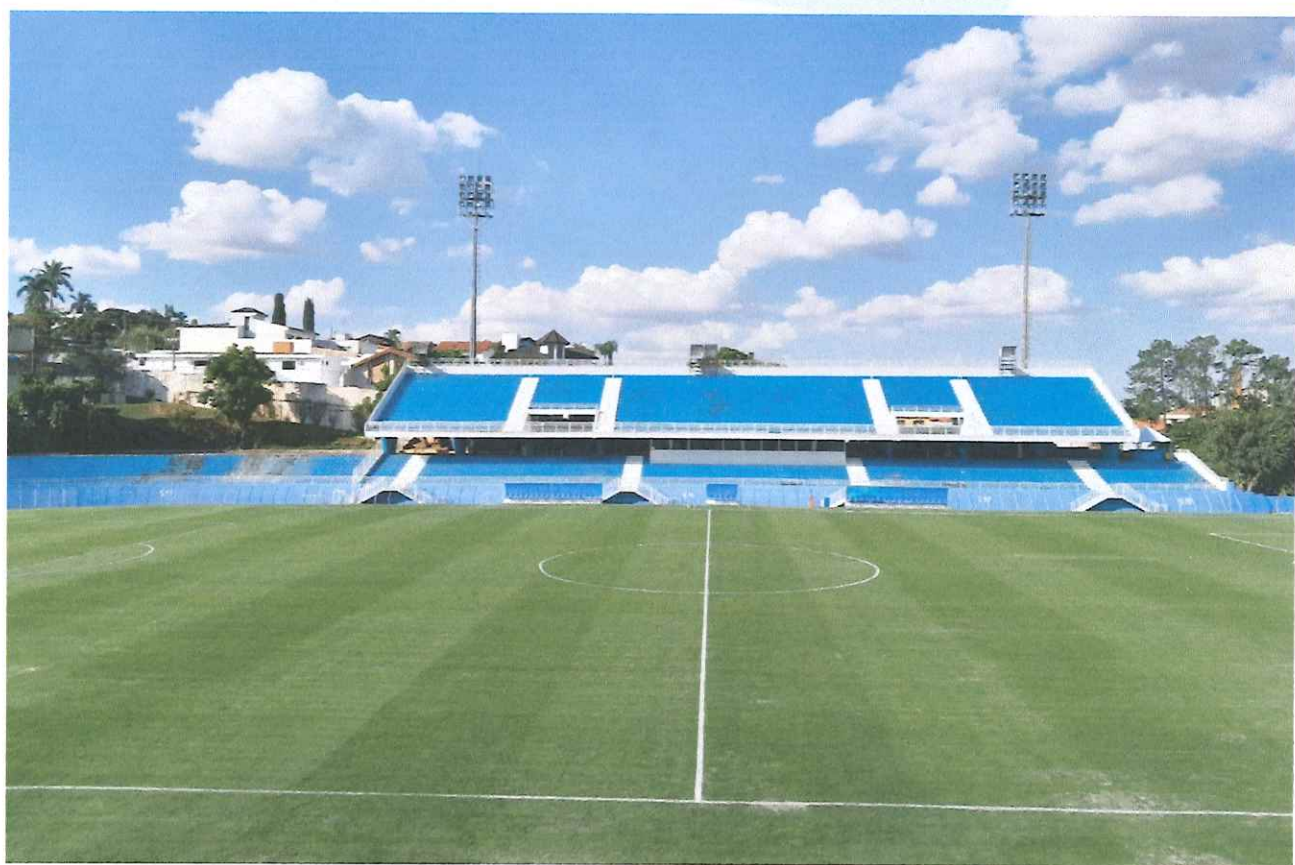
Figura 7 - Evolução do gramado.