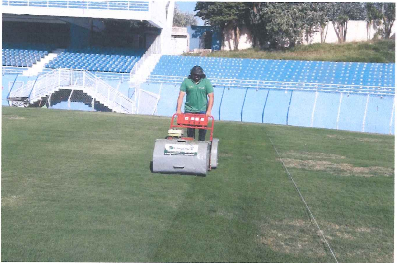
Figura 4 - Corte mecanizado.