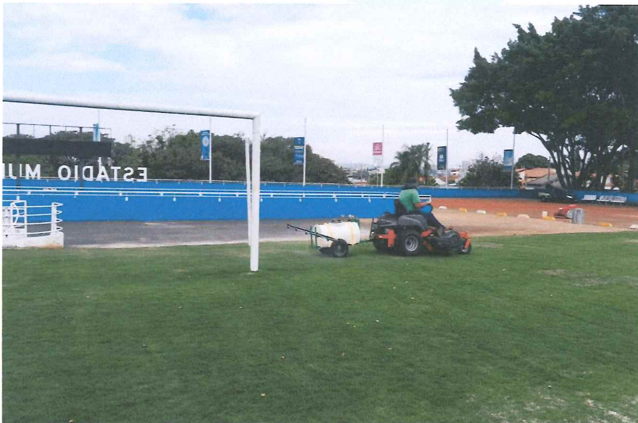
Figura 3 - Adubação.