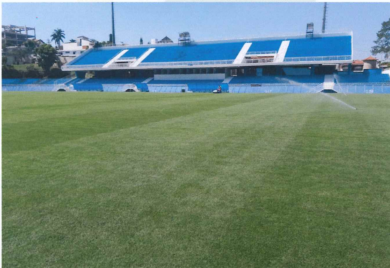
Figura 1 - Evolução do gramado.