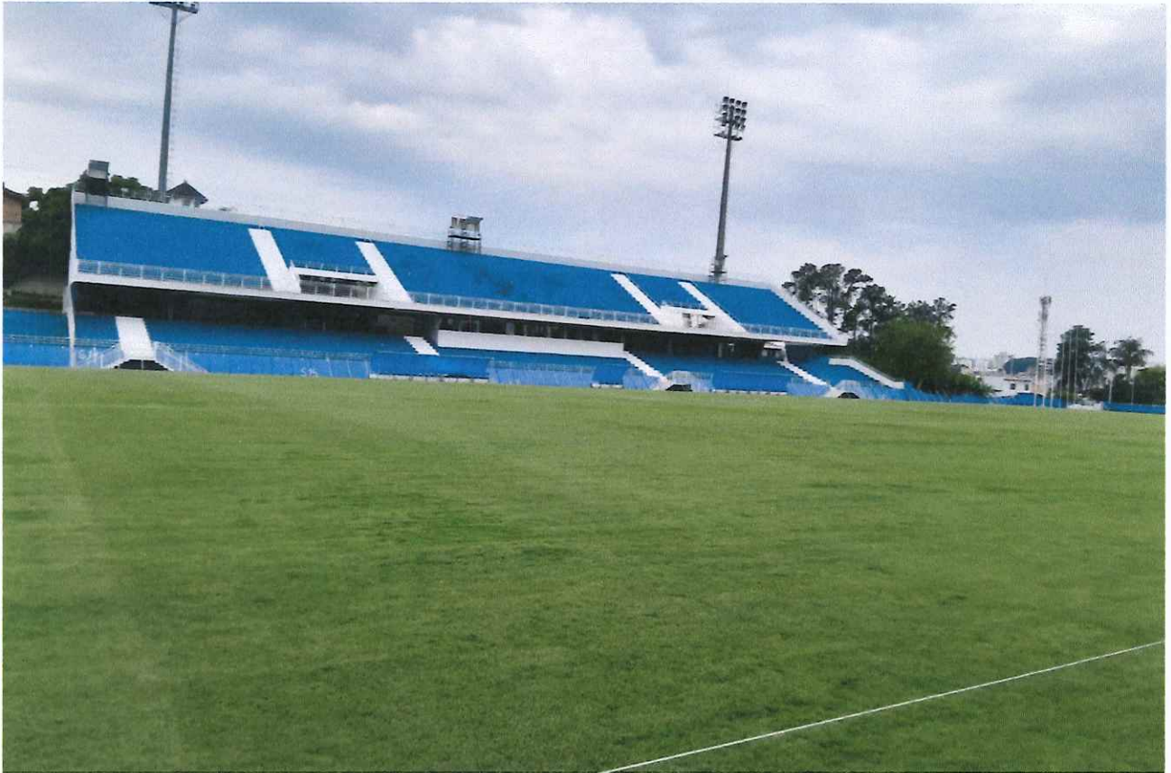
Figura 8 - Evolução do gramado.