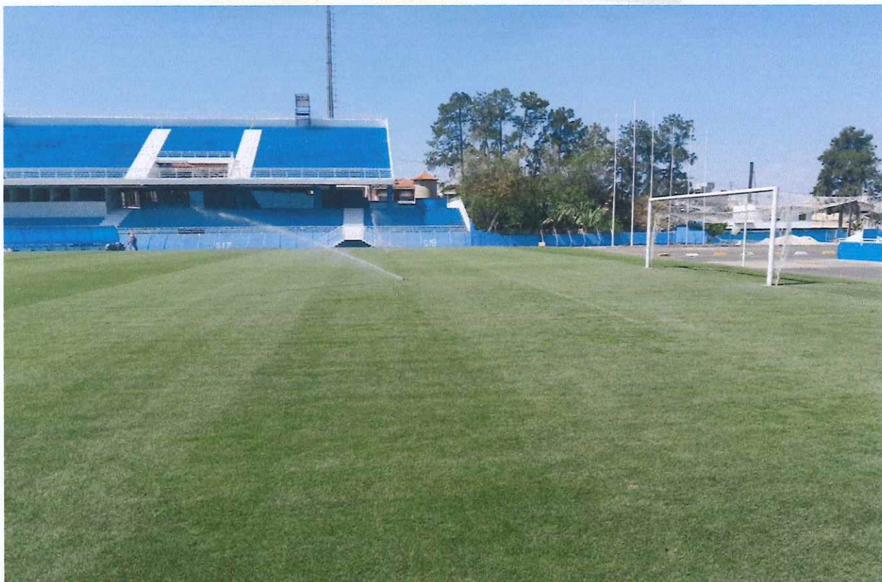
Figura 3 - Evolução do gramado.