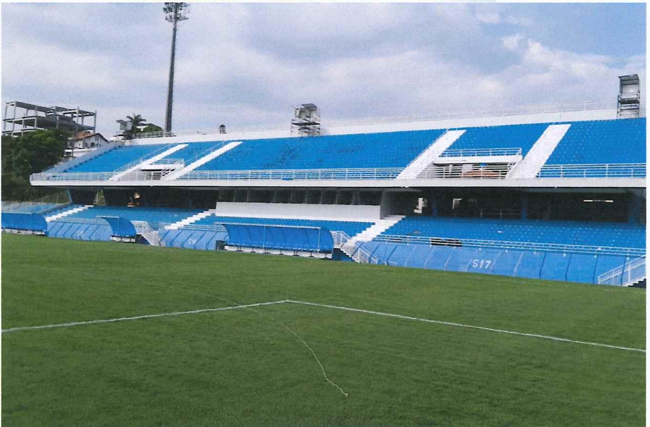
Figura 9 - Evolução do gramado.