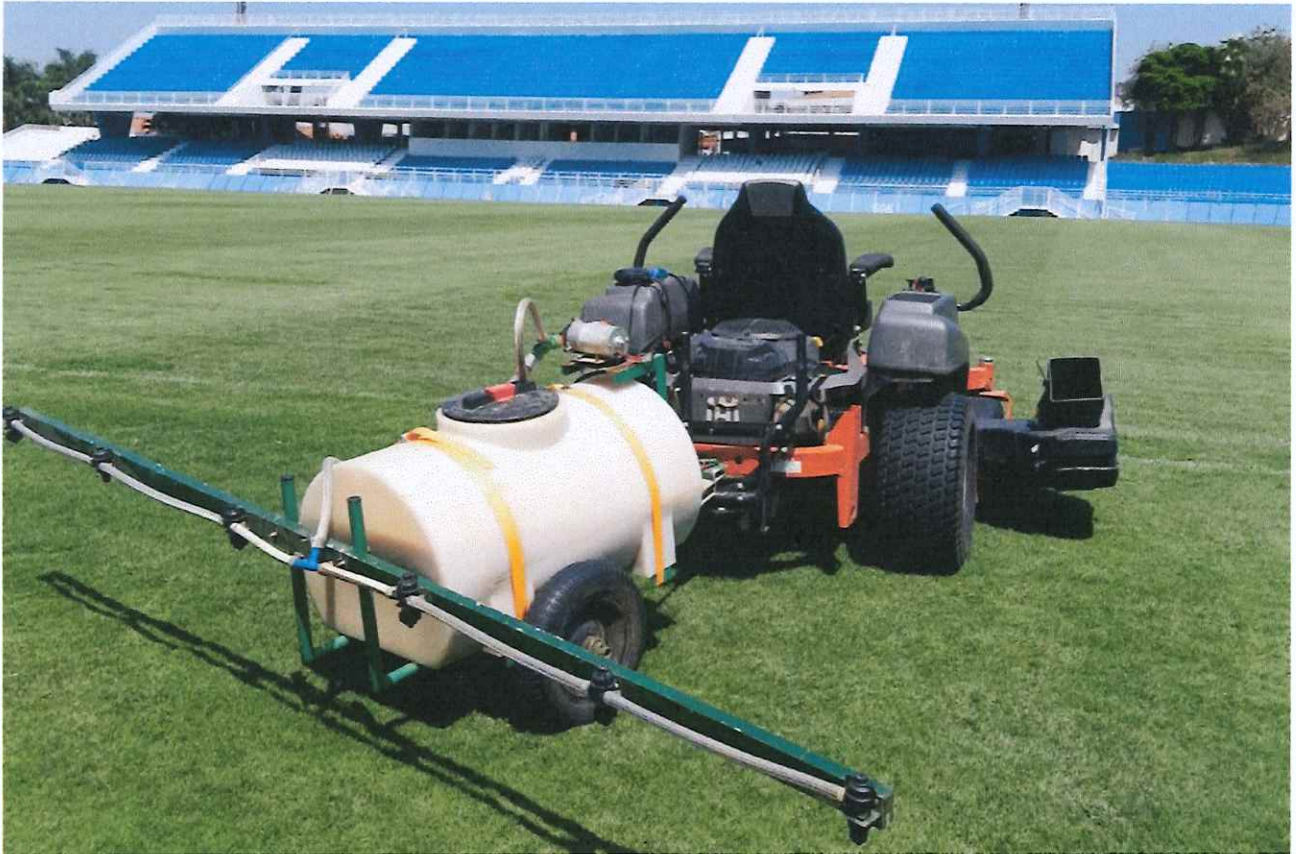
Figura 6 - Controle fitossanitário.