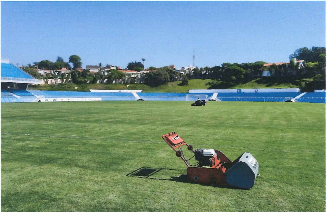
Figura 7 - Corte mecanizado.