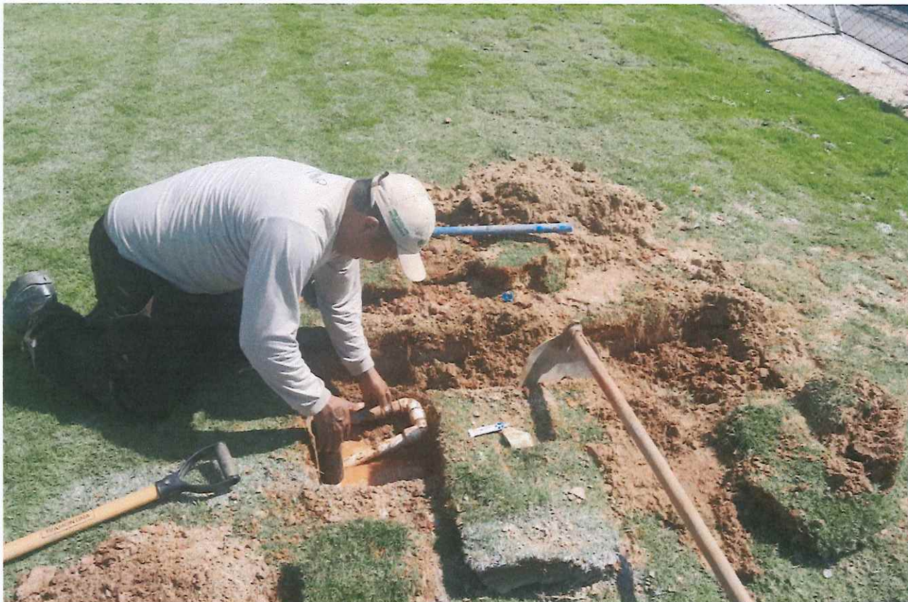
Figura 4 - Ajustes no sistema de irrigação.