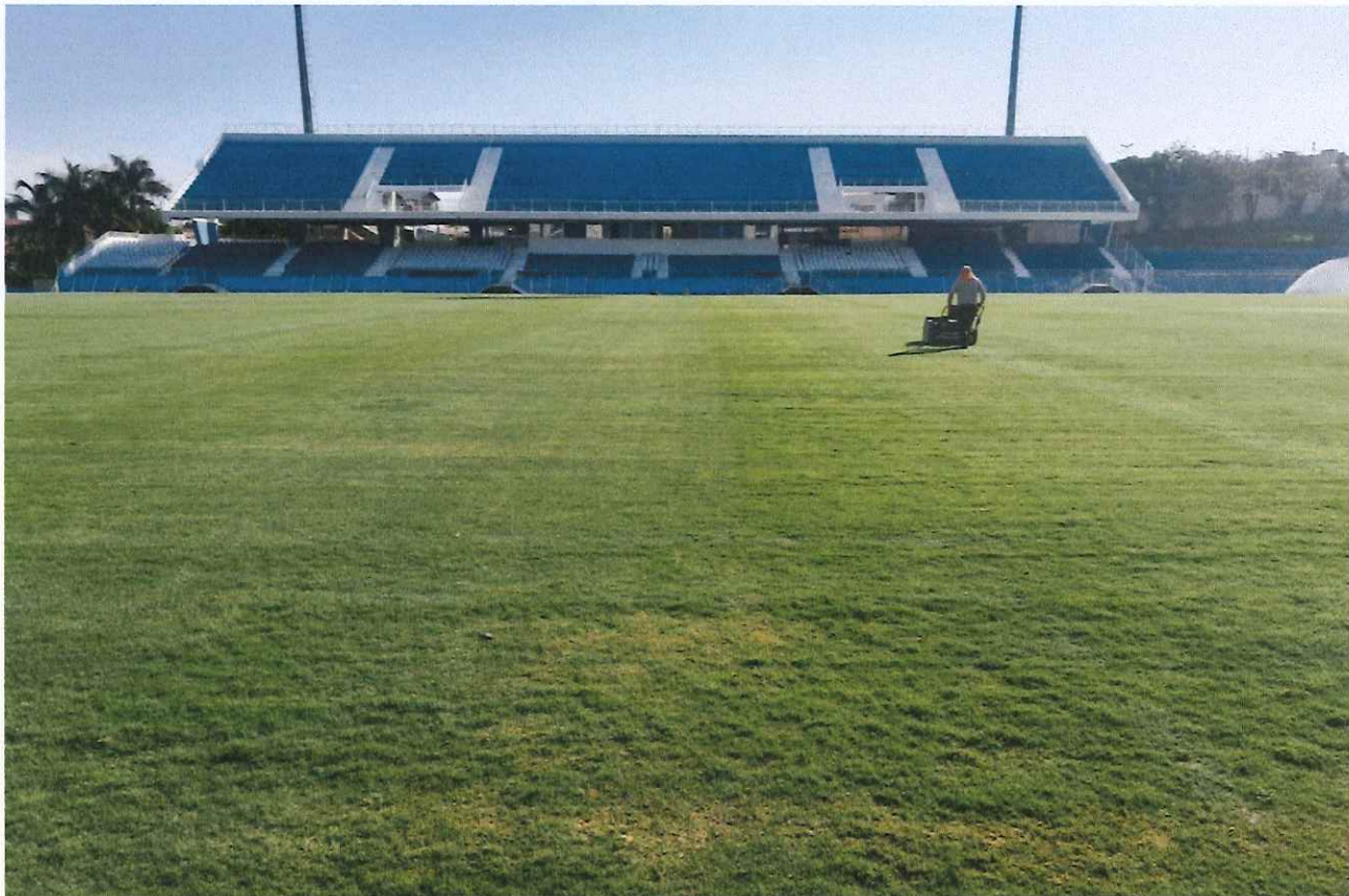
Figura 2 - Corte mecanizado.