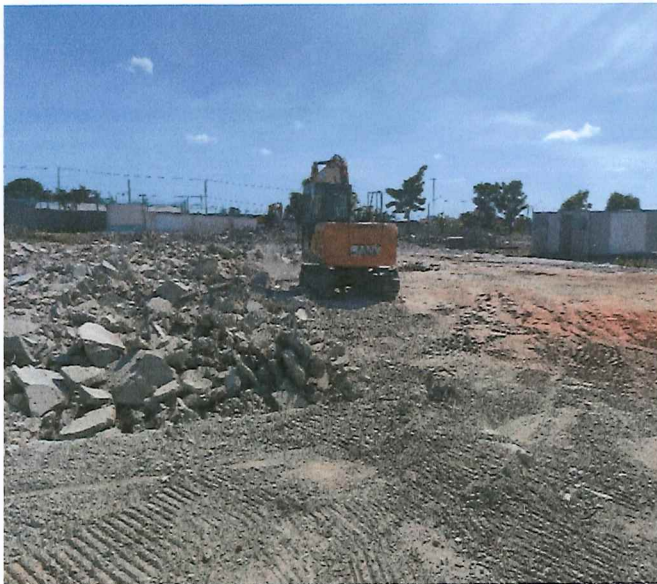
REMOÇÃO DE ALVENARIA E PARALELEPIPEDO