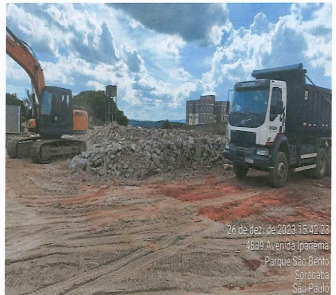
ESCAVAÇÃO E TRANSPORTE DE SOLO

Ruthiele Forte Eng a Civil Crea: 5069 831254