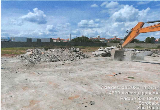
REMOÇÃO DE PAVIMENTO E ALVENARIA

CONTRATADA: REISCON CONSTRUTORA E TERRAPLENAGEM