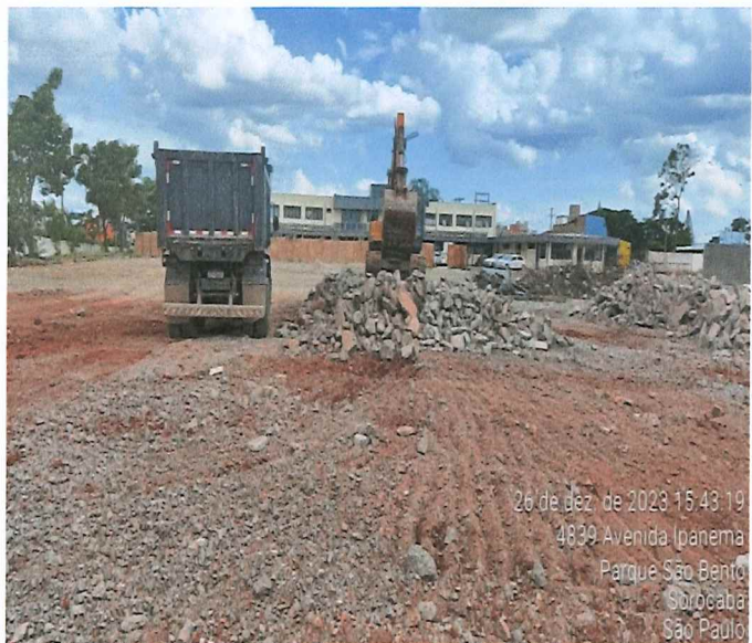
ESCAVAÇÃO E TRANSPORTE DE SOLO