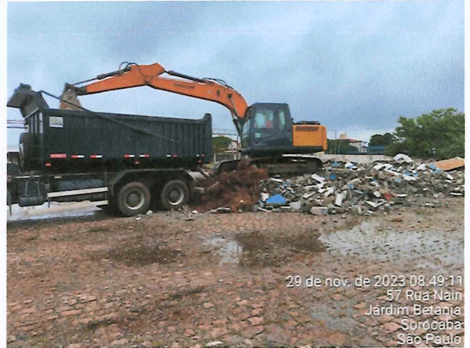
REMOÇÃO E TRANSPORTE DE ENTULHO