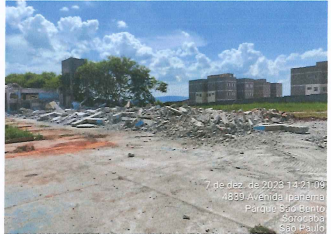
REMOÇÃO DE PAVIMENTO E ALVENARIA