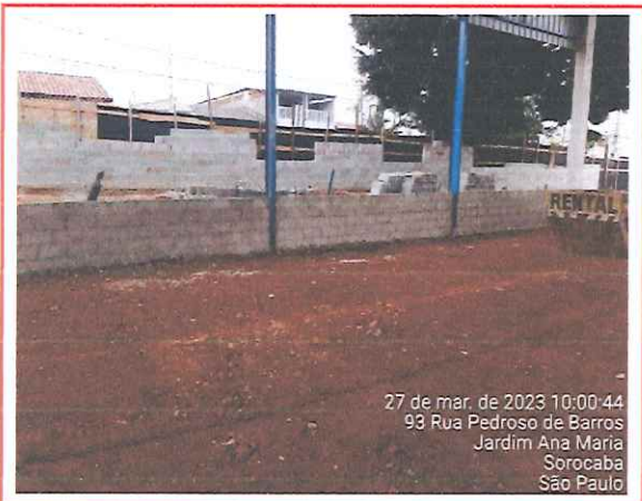
27 de mar. de 2023 10:00:44 93 Rua Pedroso de Barros Jardim Ana Maria Sorocaba São Paulo