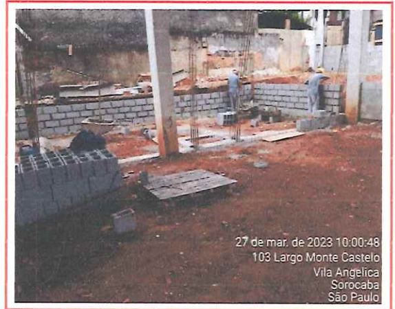
27 de mar. de 2023 10:00:48 103 Largo Monte Castelo Vila Angelica Sorocaba São Paulo