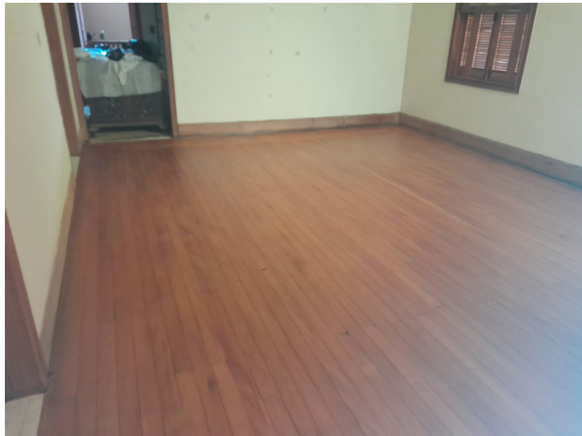
Foto 89: Finalizado a raspagem, calafetação , lixamento e aplicação de cera;