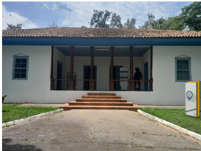
Foto 104: Raspagem e pintura com stain as colunas e retoques finais de pintura a cal e limpeza final concluída;