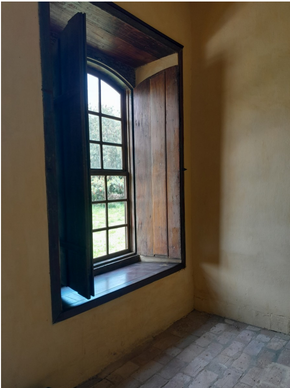
Foto 117: Restauro, decapagem e pintura com stain nas janelas externas;