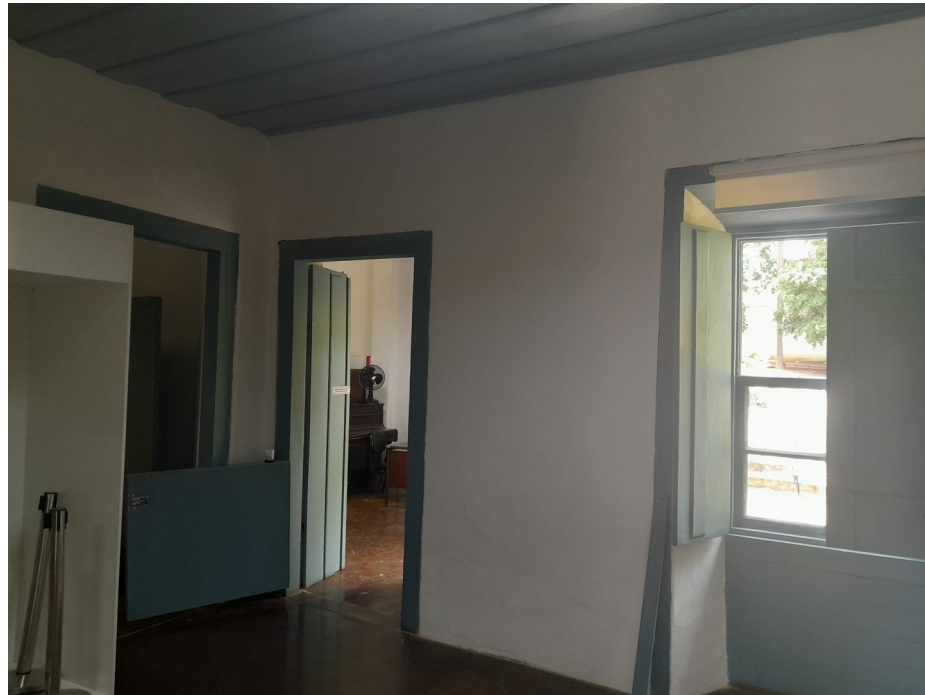
Foto 105: Pintura a cal interna finalizada e limpeza final concluída;