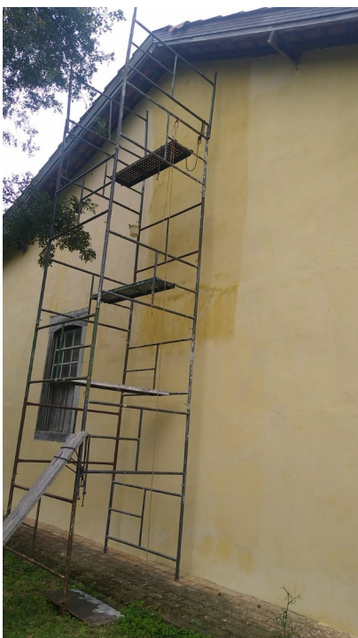
Foto 106: Finalização das pinturas externas a cal e restauro dos beirais;