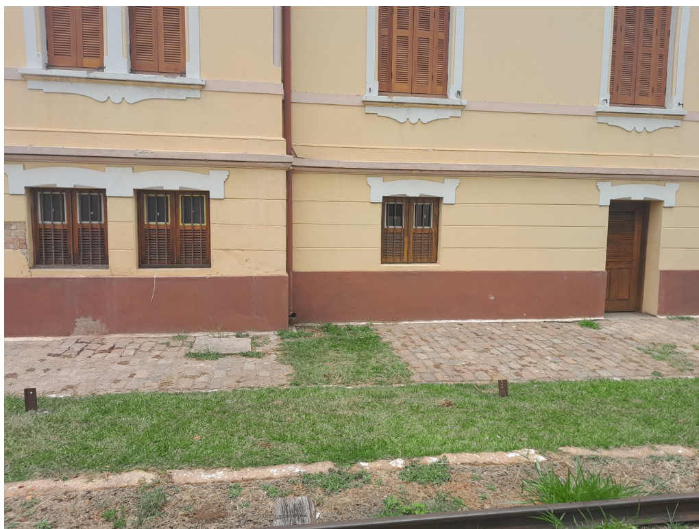
Foto 97: Visão geral das janelas e porta restauradas e envernizadas ;