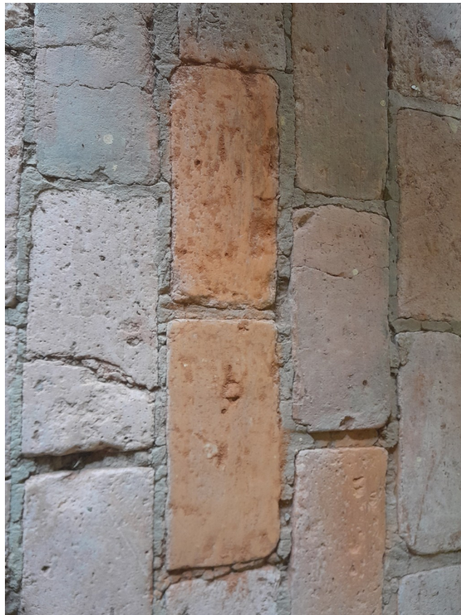
Foto 111: Detalhe de tijolos com as mesmas dimensões trocados no piso interno da casa;