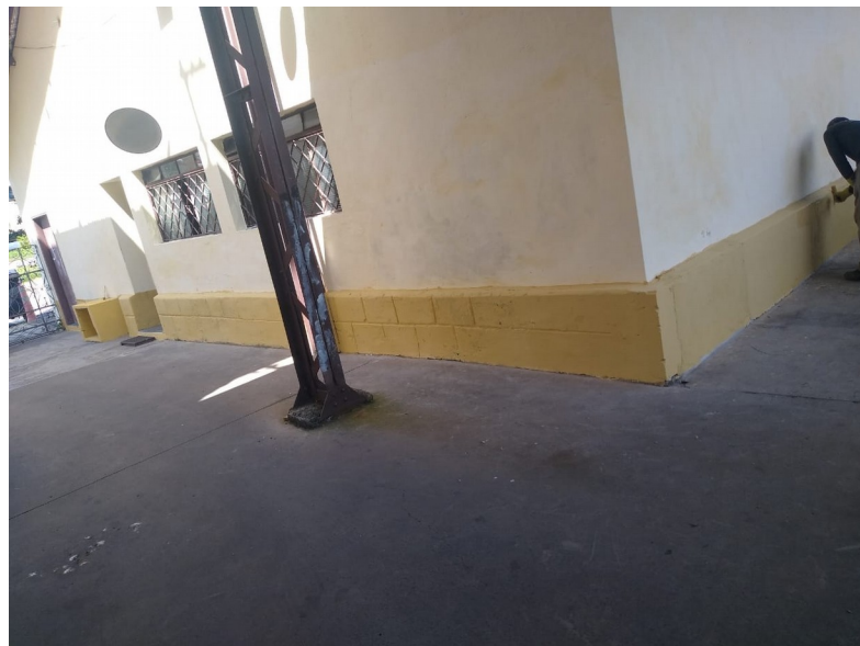
Foto 85: Retoques finais na pintura externa na área da guarda municipal;