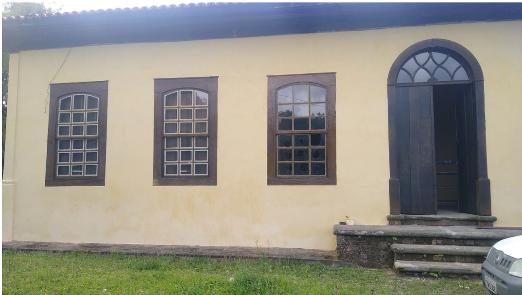
Foto 108: Pintura das janelas, porta e beirais das fachadas externas e limpeza da escada de entrada;