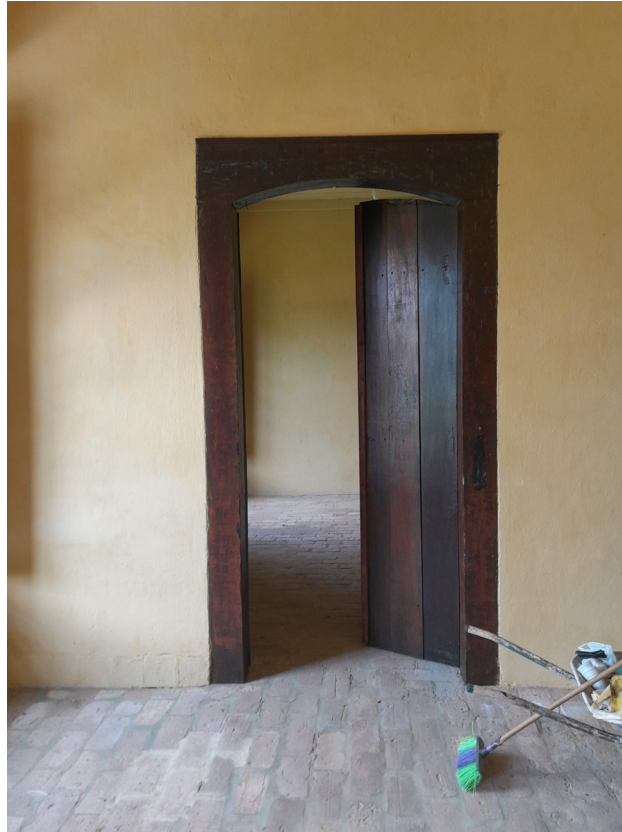
Foto 118: Restauro, decapagem e pintura com stain nas portas internas e externas;