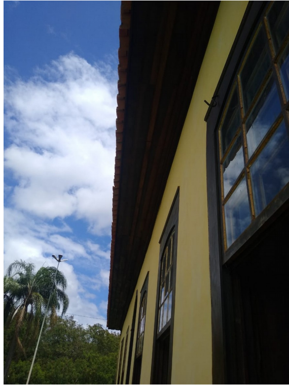
Foto 107: Pintura com verniz dos beirais e janelas e retoques finais na pintura a cal;