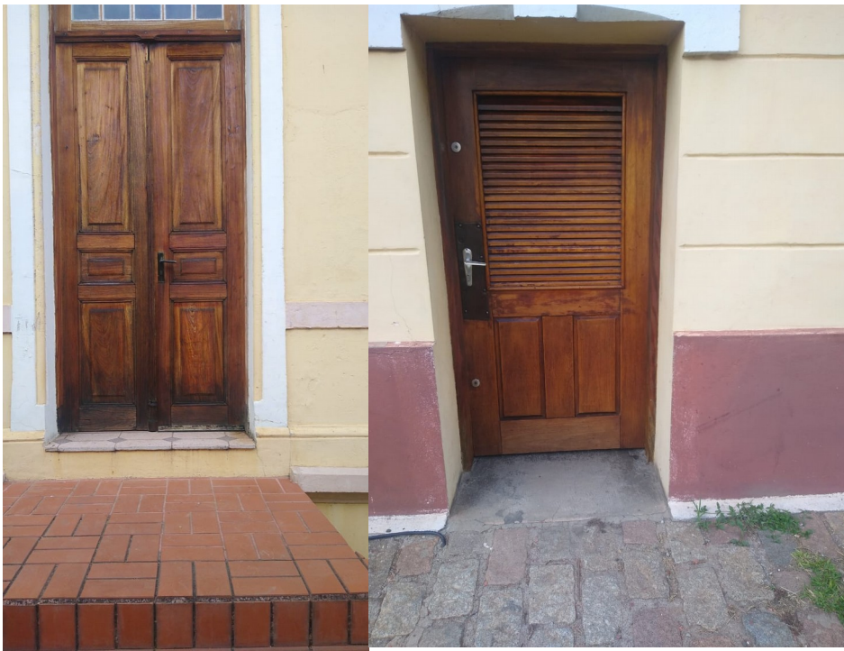
Fotos 93 e 94 : Restauro, raspagem e aplicação de verniz nas portas externas;