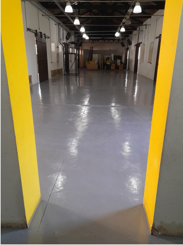
Foto 84: Finalização da pintura epoxi e limpeza final finalizados.