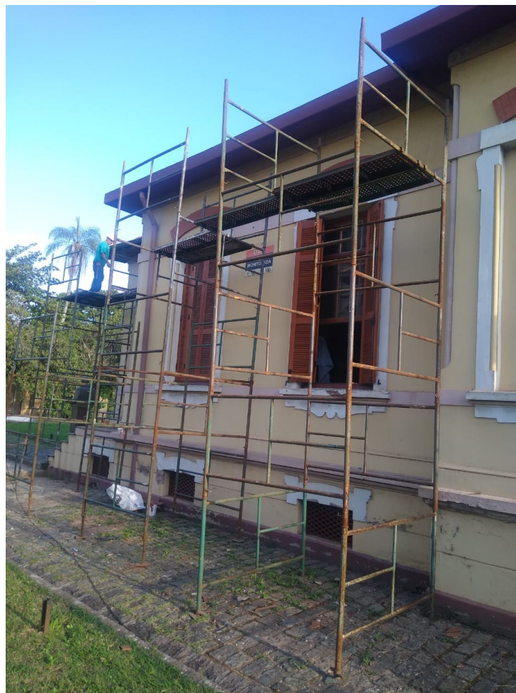
Foto 99: Colocação das tabeiras, forros e pintura nas fachadas externas;