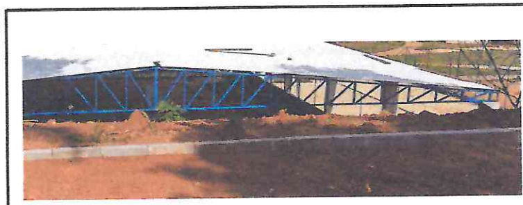
94273 - ASSENTAMENTO DE GUIA (MEIO-FIO) EM TRECHO RETO, CONFECCIONADA EM CONCRETO PRÉ-FABRICADO