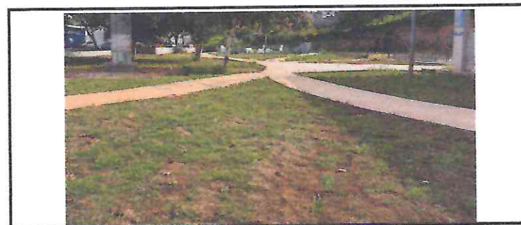
85180 - PLANTIO DE GRAMA ESMERALDA EM ROLO