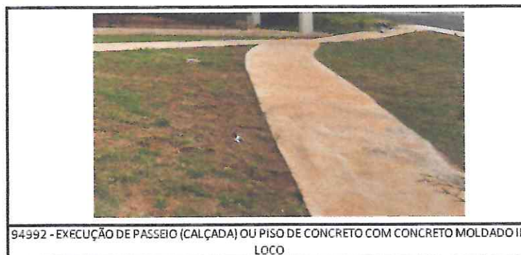
94992 - EXECUÇÃO DE PASSEIO (CALÇADA) OU PISO DE CONCRETO COM CONCRETO MOLDADO IN LOCO