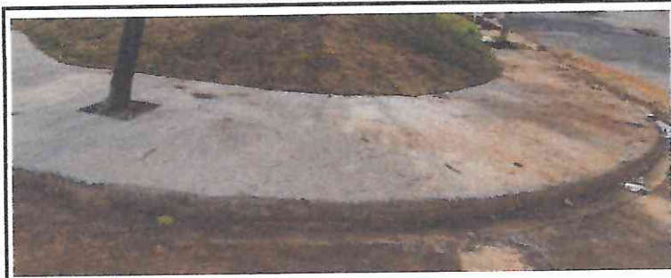
94273 - ASSENTAMENTO DE GUIA (MEIO-FIO) EM TRECHO RETO, CONFECCIONADA EM CONCRETO PRÉ-FABRICADO