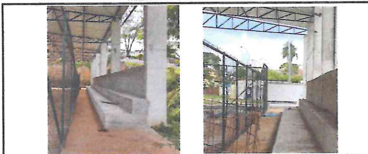
17.01.020 - ARGAMASSA DE REGULARIZAÇÃO E/OU PROTEÇÃO (piso de arquibancada)