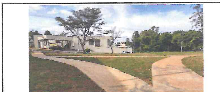
94992 - EXECUÇÃO DE PASSEIO (CALÇADA) OU PISO DE CONCRETO COM CONCRETO MOLDADO IN LOCO