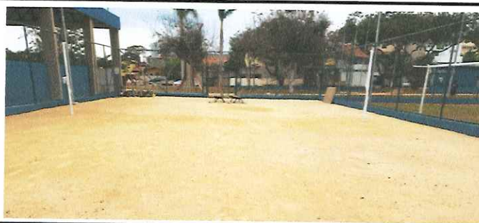
QUADRA DE AREIA