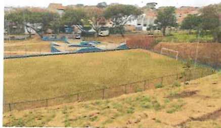
CAMPO DE FUTEBOL