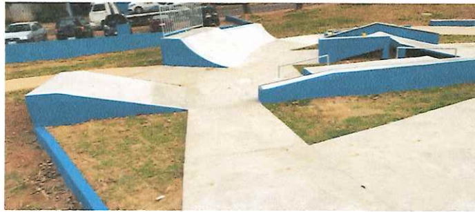
PISTA DE SKATE