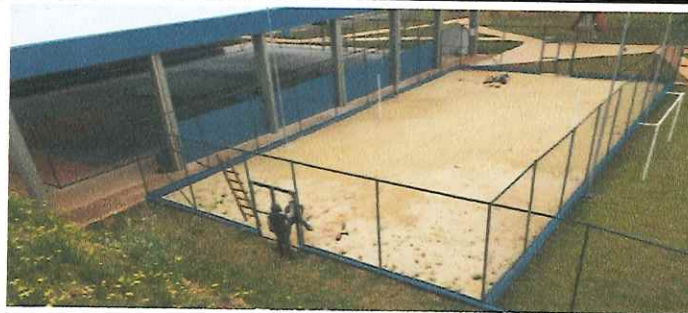
QUADRA DE AREIA