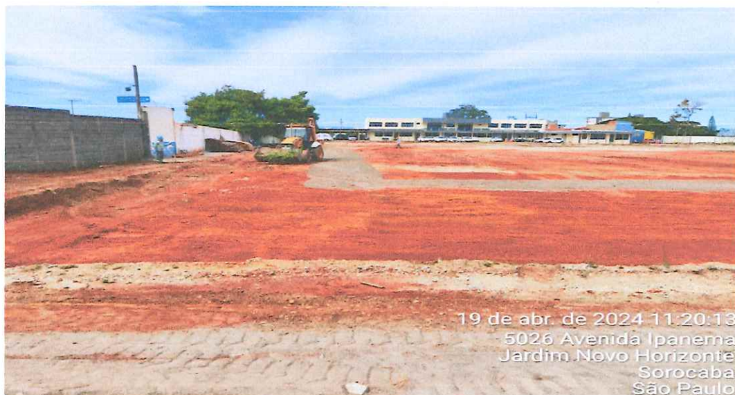
19 de abr. de 2024 11:20:13 5026 Avenida Ipanema Jardim Novo Horizonte Sorocaba São Paulo