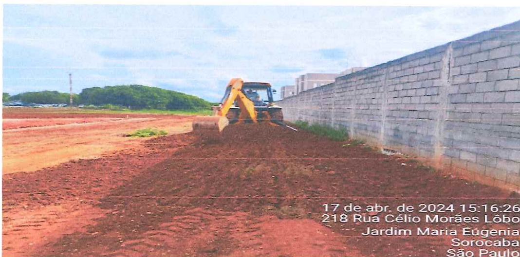
17 de abr. de 2024 15:16:26 218 Rua Célio Morães Lôbo Jardim Maria Eugénia Sorocaba São Paulo